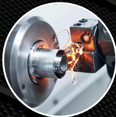
Производство любой продукции под заказ