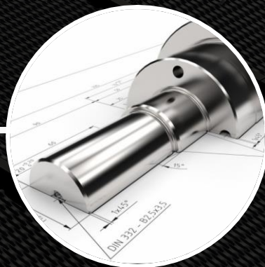
Изготовление деталей по чертежам